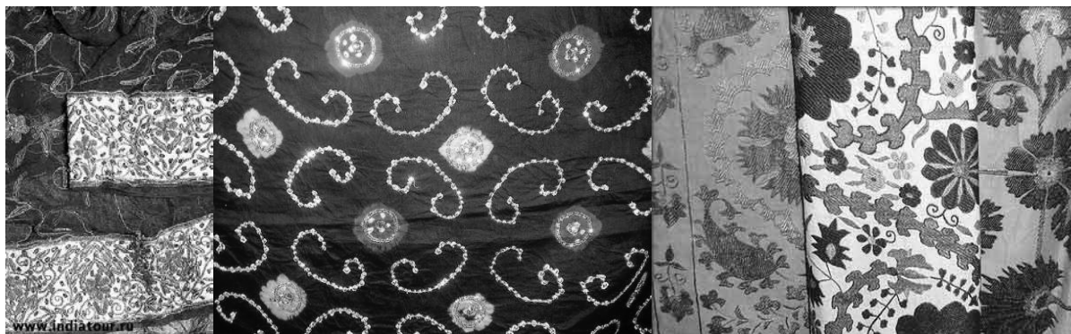
Рис. 3. Ткани, используемые в индийских женских костюмах

Изучая одежду, украшения, ткани Индии, понимаешь какая это удивительная страна с богатейшей культурой. И неслучайно очень многие дизайнеры в качестве творческого источника для своих коллекций используют индийское сари. Очарование этого элегантного и утонченного наряда, его изысканная красота никогда не утратят привлекательность, поэтому сари никогда не выйдет из моды. Разнообразие ярких цветов, многообразие фасонов, богатство тканей, декоративных деталей, все это актуально как никогда.