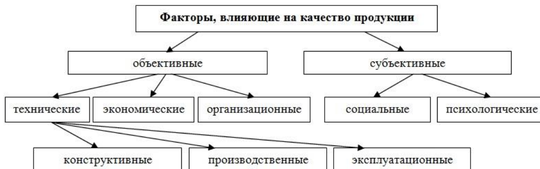
Рис. 2. Основные факторы, используемые при оценке качества продукции

Существует еще одно довольно распространенное деление факторов, влияющих на качество продукции, – на субъективные и объективные. Субъективные факторы связаны с деятельностью человека и зависят только от него.