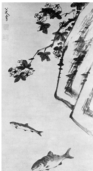
Рис. 1. Бадашань Жэнь «Цветок, скала и две рыбы» [11]