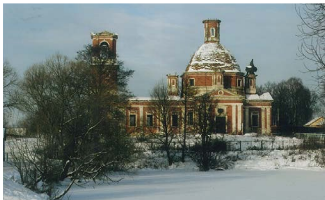
Архитектор А. П. Евлашев. Церковь Рождества Христова с приделом иконы Казанской Божьей Матери. 2008 г.

Сохранение стойких художественных предпочтений, сформированных при взаимодействии заказчика в лице императорской власти и архитектора московской гофинтендантской конторы А. П. Евлашева на протяжении достаточно длительного временного периода его творческой биографии, диктовалось, по нашему мнению, символикой, связанной с архитектурой, возникшей во время правления каждого из них или ранее. Толкование «символики архитектурного языка» в таких случаях достаточно сложно, потому что многое для понимания было доступно немногим в силу разных причин, одной из которых являлось сознательное желание сделать этот смысл тайным.